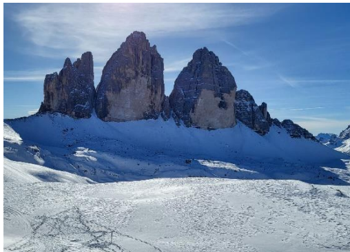
Le tre cime di Lavaredo al confine tra Belluno e Trentino

A cura di Enrica Colmanet enrica.colmanet@scuola.istruzione.it