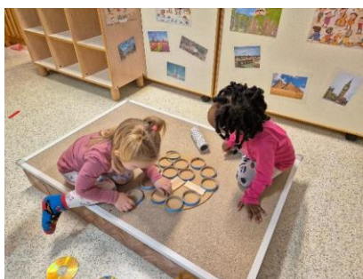
Bimbe in collaborazione per la creazione di una pizza speciale con materiale destrutturato al nido Villaggio del Sole