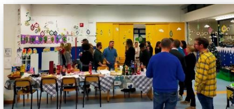
Apericena con i genitori Scuola dell'infanzia "zattieri del Piave" Ponte nelle Alpi