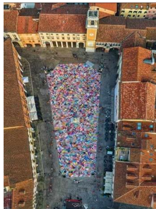
La piazza Vittorio Emanuele II di Rovigo