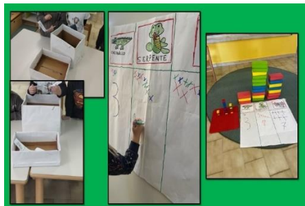
Fase dello scrutinio. Scuola dell'Infanzia statale "Fratelli Grimm" IC di Roncade