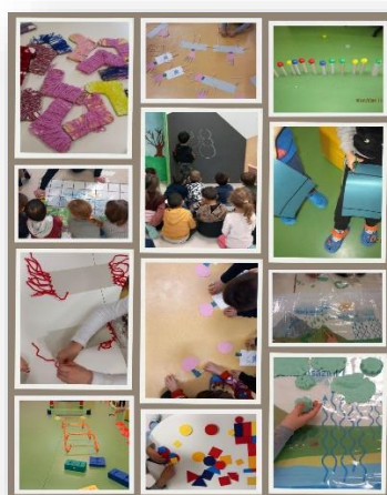
Scuola dell'infanzia "V. da Feltre" Bornio