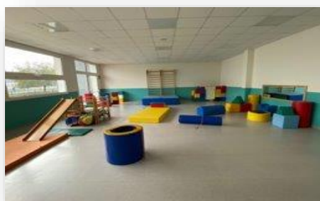
Setting psicomotorio predisposto per i bambini Sezione Primavera Scuola Infanzia Statale IC Carmignano Fontaniva (PD)