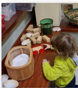
Bimbo intento alla ricerca dell'equilibrio nella creazione di una macchinina al nido Villaggio del Sole