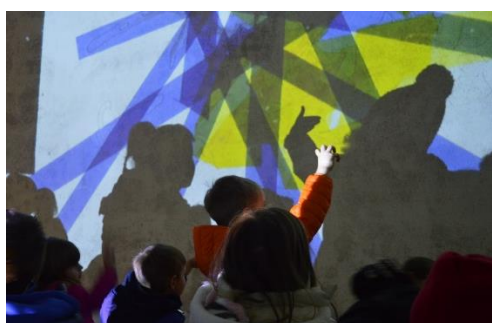
Centro Infanzia 0-6 Terre D'Infanzia Uscita presso EATALY per la mostra Bruno Munari