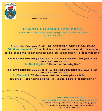
Piano di formazione congiunta CPT VENEZIA 2023