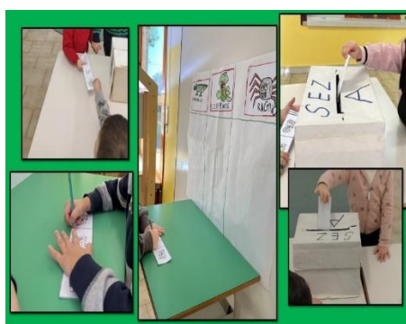
Giornata del voto. Scuola dell'Infanzia statale "Senza zaino" – "Fratelli Grimm" IC di Roncade