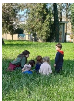
Scuola Inf. Laghetto, IC 8 Vicenza tirocinante in ascolto e osservazione