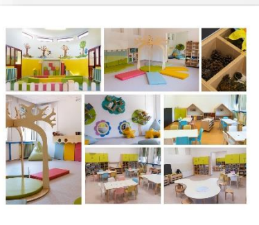
Gli spazi presso la Scuola dell'infanzia "V. da Feltre" Bornio