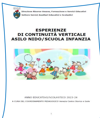
Copertina Continuità Verticale condivisa Servizi 0-6 territorio Comune di Venezia