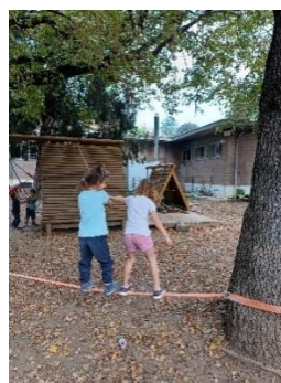
Scuola Infanzia Laghetto, IC 8 Vicenza: Facilitazione di relazioni interpersonali: la camminata in due sulla corda