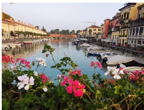
Ponte sul Mincio a Peschiera del Garda (VR)