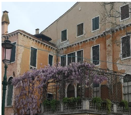
Campo San Giacomo dall'Orio