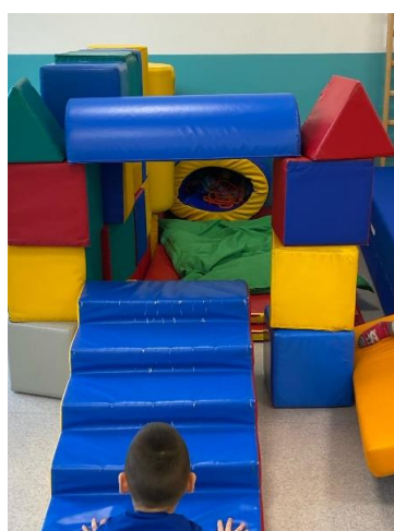
"Insieme: emozionare -sperimentare - esplorare"