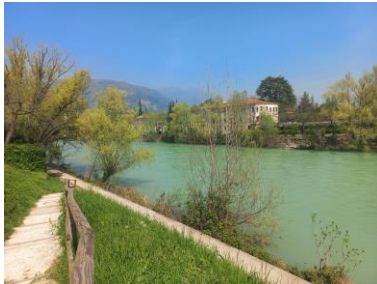
Percorso pedonale lungo il fiume Brenta a Bassano del Grappa