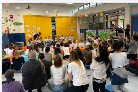
Senza zaino day Scuola dell'infanzia "zattieri del Piave" Ponte nelle Alpi