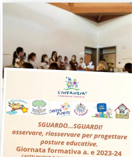
Giornata formativa Staff Cooperative L'Infanzia Lugagnano di Sona Verona