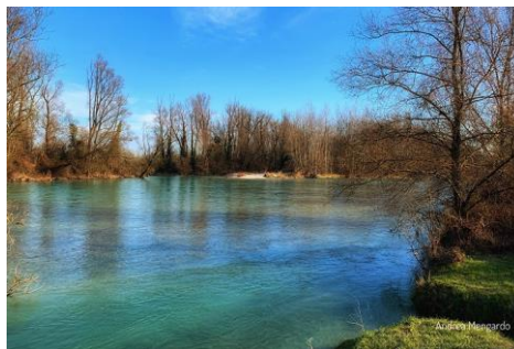
Natura fiume Brenta a Fontaniva di Padova

A cura di Lucilla Zava lucilla.zava@scuola.istruzione.it