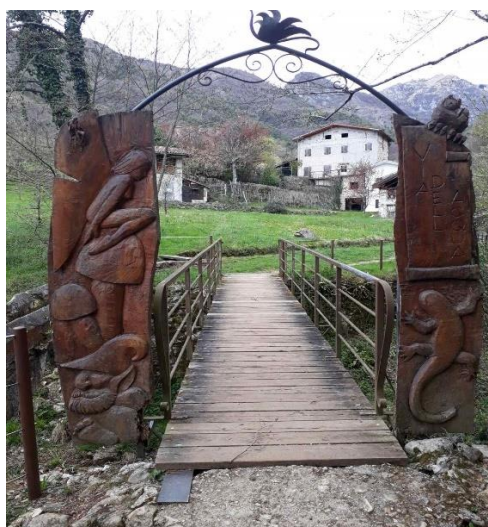
La via dell'Acqua a Cison di Valmarino